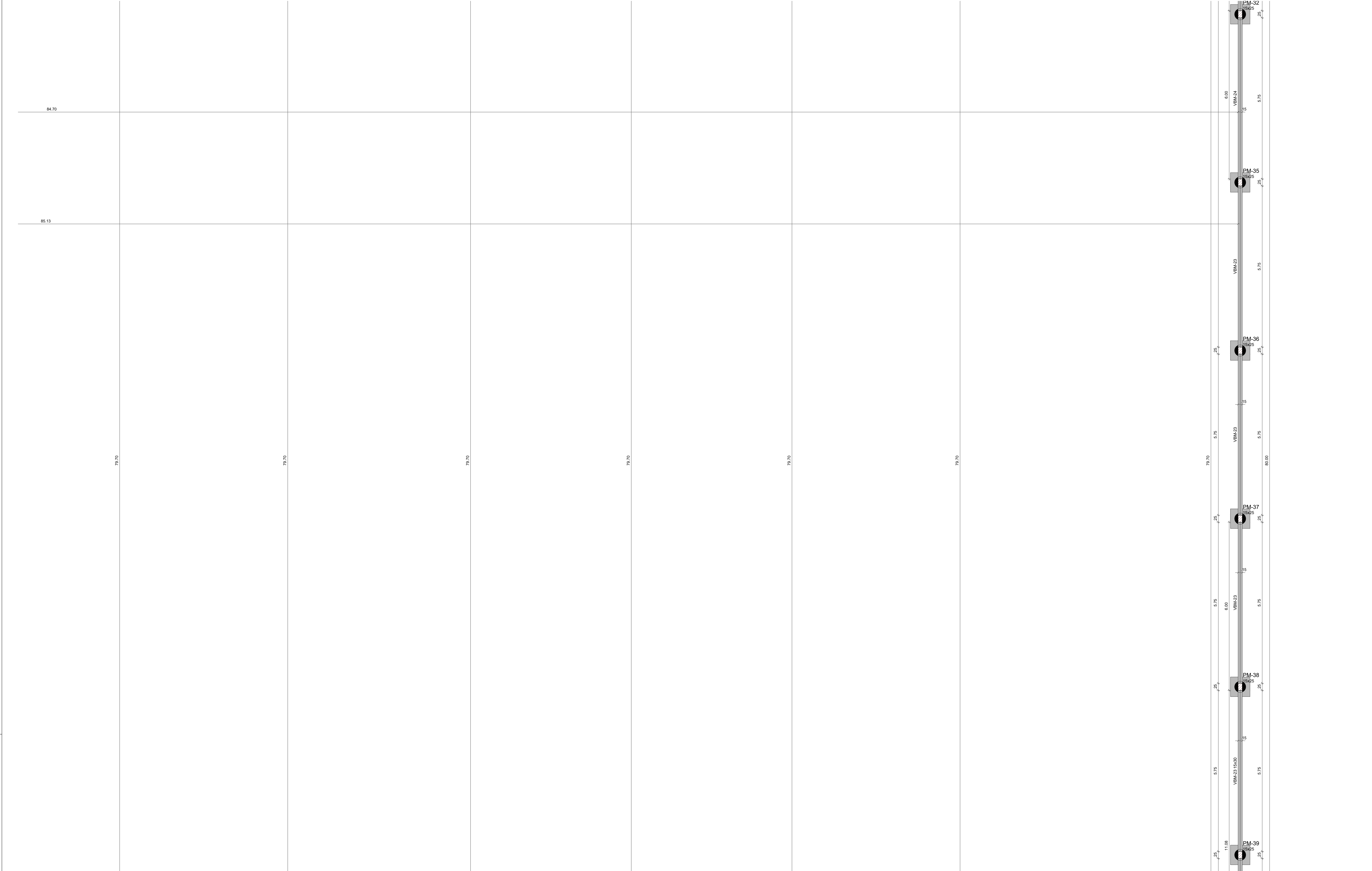
1 PLANTA DE FORMA FUNDAÇÃO - PARTE E ESCALA 1/50